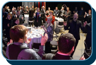
Un Gala haut en couleur et participatif